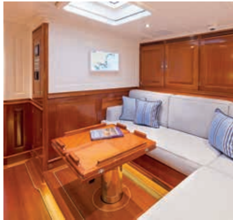
boven: De gezellige bar in het achterschip, direct onder de centrale kuip gelegen. Het zal er goed toeven zijn na een wedstrijd