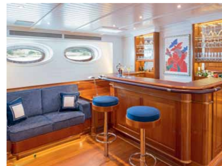
Warme Mahagoni-Töne in Kombination mit weissen Wänden und Decken werden kontrastiert durch Edelstahl und ergänzt durch Teppiche und einen Multifunktions-Tisch aus Leder in Beige-Tönen. Von oben nach unten: Master-Salon, Backbord-Seite, Doppelbett (links davon Zugang zum Kapitän's-Navi-Deckshaus per Luftdruck-Schiebetür) und Master-Salon, Steuerbord-Seite, mit Bar und direktem Zugang zum Control-Raum (im Foto nicht sichtbar).