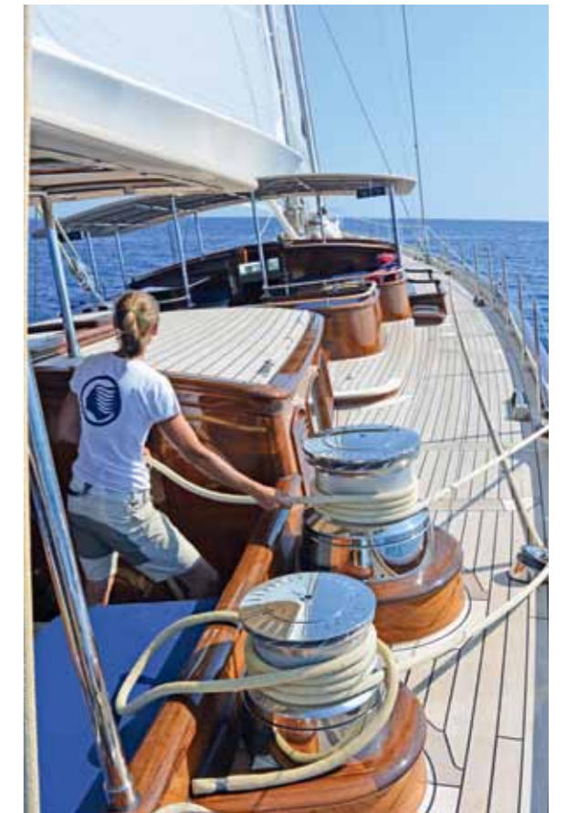
Vier Crew-Mitglieder können die 127 Fuss lange Yacht mühelos im Cruising-Modus bewegen. Bei Regatten müssten es mindestens dreimal so viele sein. Die teilweise selbstholenden Winschen sind elektrisch unterstützt.